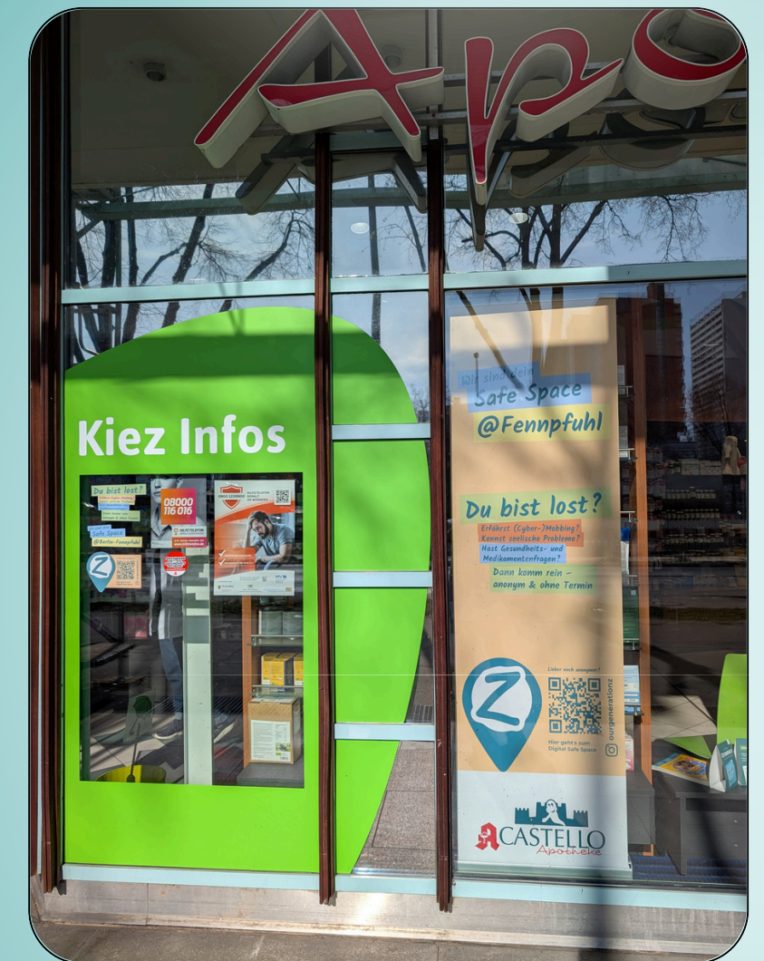
Castello-Apotheke in Berlin-Lichtenberg