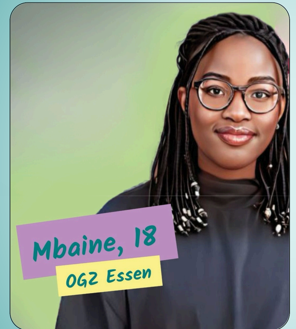
Mbaine, 18 OGZ Essen