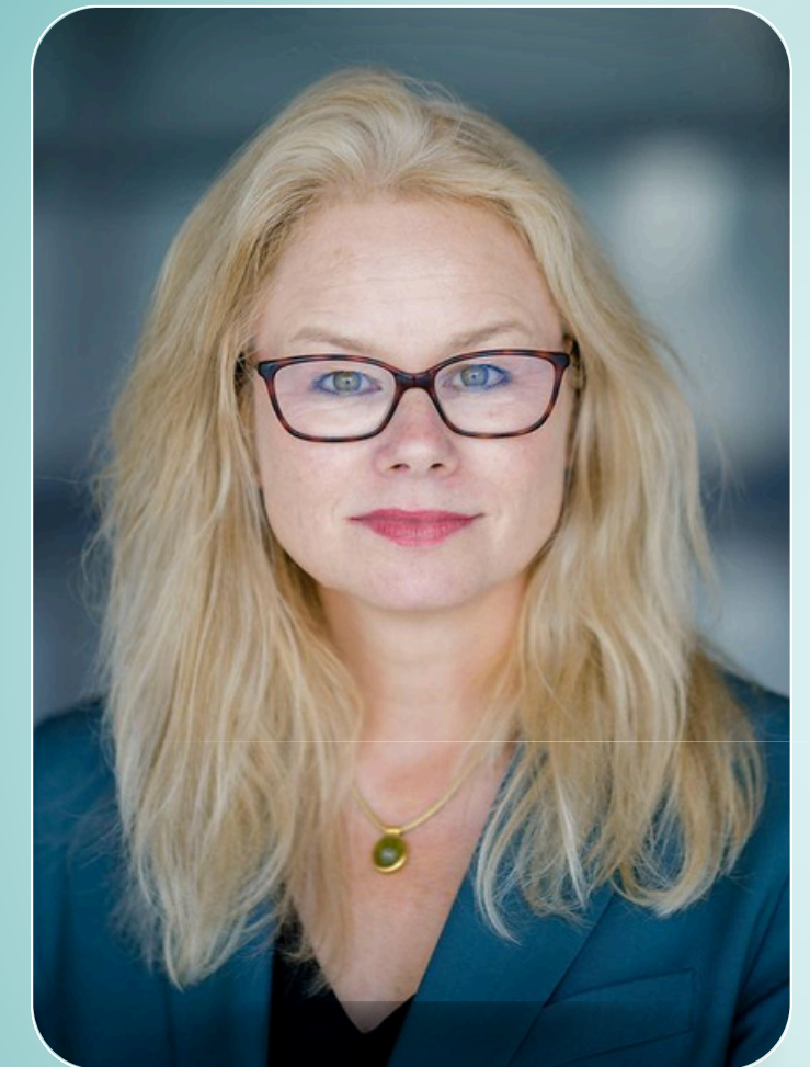
Dr. Kirsten Kappert-Gonther, Präsidentin der Bundesvereinigung für Prävention und Gesundheitsförderung und Sprecherin für Gesundheits-, Religions- und Kulturpolitik

Dr. Kirsten Kappert-Gonther, Statement über die OurGenerationZ