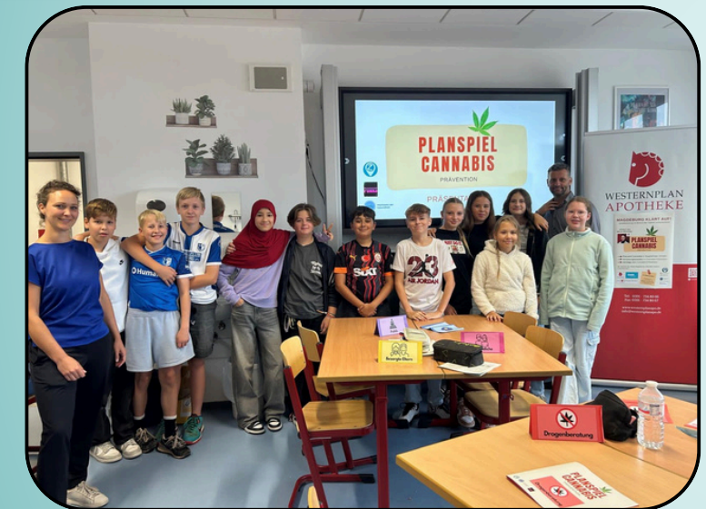
Das Planspiel "Cannabis" wird am Magdeburger Editha-Gymnasiums gespielt