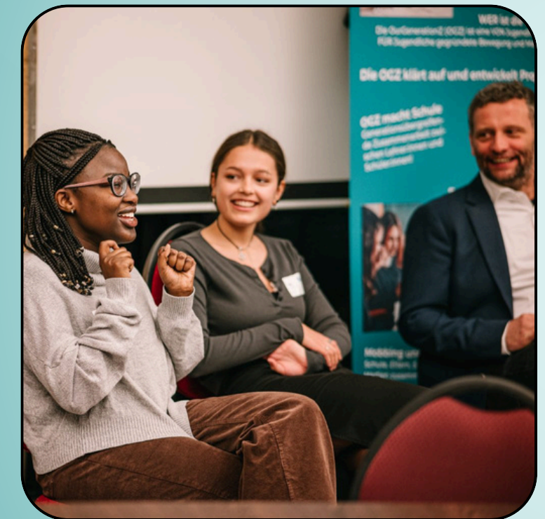
GenerationZday in Essen mit der OGZ Essen und der OGZ Coesfeld